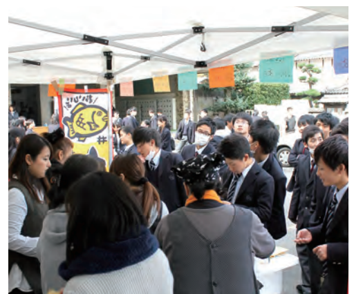
臥龍祭たい焼販売

本校は、2005年県立高等学校再編整備に伴い、金川・福渡の両高等学校が統合されて開校した総合学科の学校です。総合学科は、大進路から就職まで幅広い進路希望の生徒たちがおり、それぞれが進路実現に向けて必要な学習に取り組んでいます。特に社会貢献やボランティア活動、地域課題発見解決学習(ルネス学)に力を入れており、地域に出て地域に学ぶ「御津キャンパス学」を展開し、地域と協働しながら様々な学習や活動に取り組んでいます。本校PTA活動の中心は、体育会の飲料水バザー、臥龍祭(文化