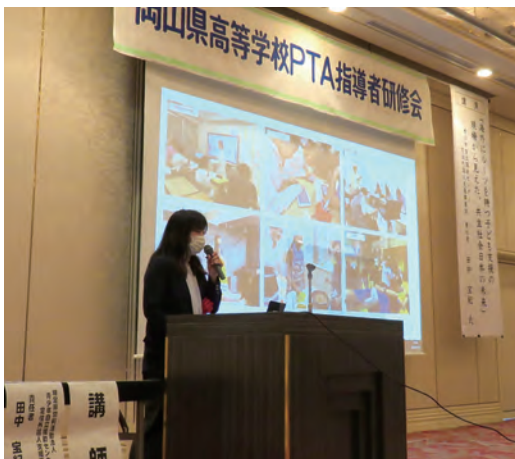
PTA指導者研修会講演

PTA指導者の資質向上や活動の充実を目的に県教育委員会と共催で開催しています。令和2年11月17日、