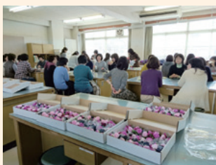
卒業式用コサージュ作り

本年度は、新型コロナウイルスの関係で、色々とPTA活動に影響が出ていますが、今後とも保護者と学校がしっかりとスクラムを組み、生徒たちの成長を手厚く支援していきたいと考えています。