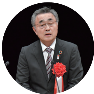
—祝辞— 倉敷市副市長 生水 哲男